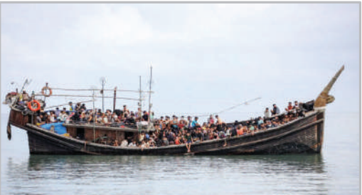
قایق حامل پناهجویان روهنجایی