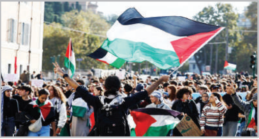
تظاهرات دانشجویان ایتالیایی در حمایت از غزه