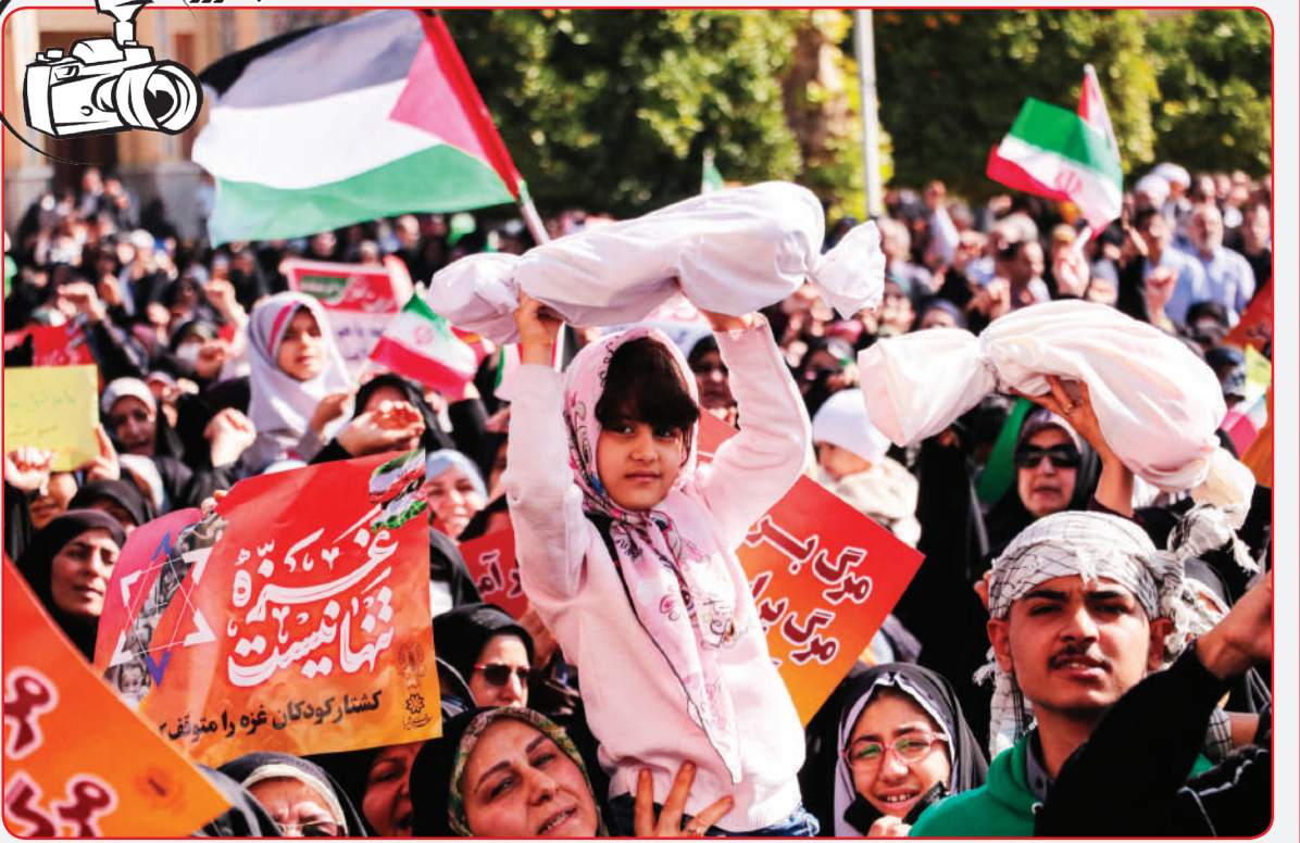
حمایت از کودکان بی‌دفاع غزه