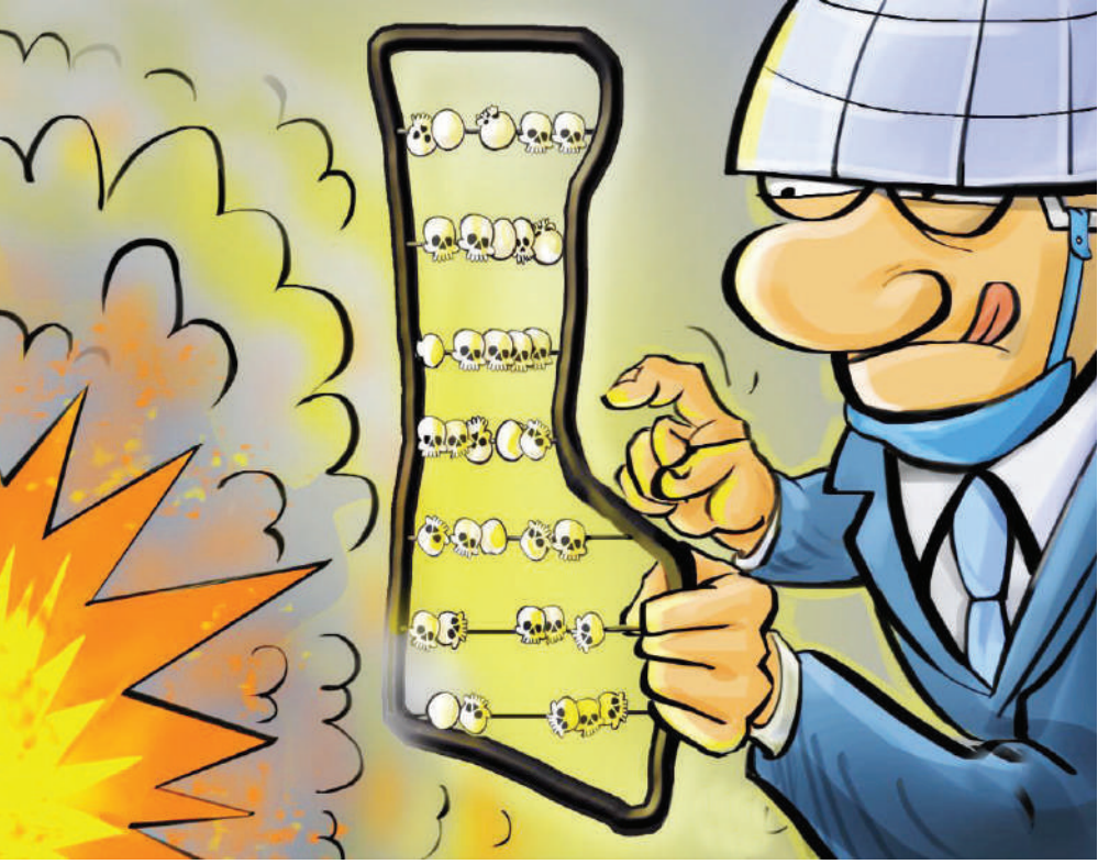
چرخه انداختن سازمان ملل