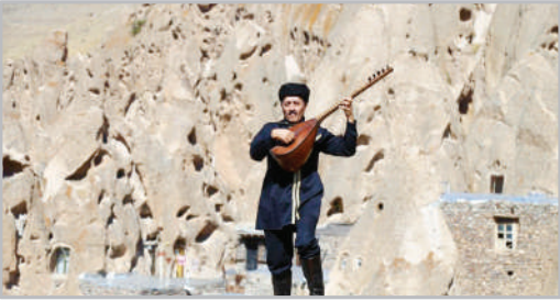
روستای صخره‌ای کندوان