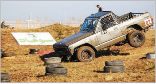
چهارمین دوره مسابقات قوی‌ترین مردان آفرود ایران - رودسر