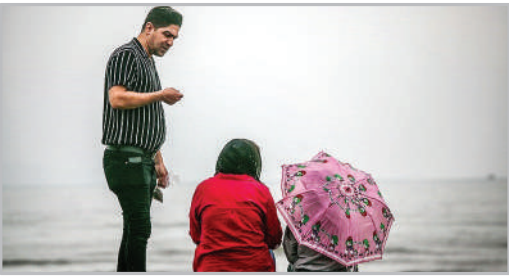
بارش باران پاییزی - بندرعباس